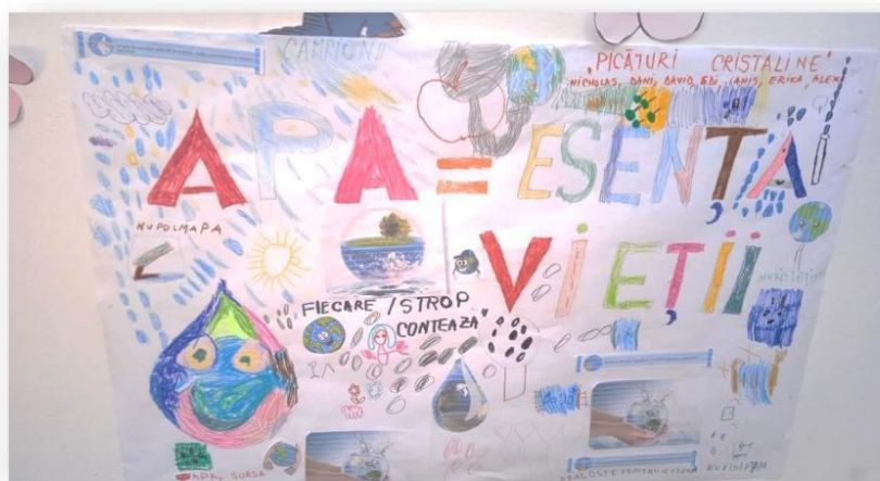
Tehnoredactat, Inf.Tânase Rodica