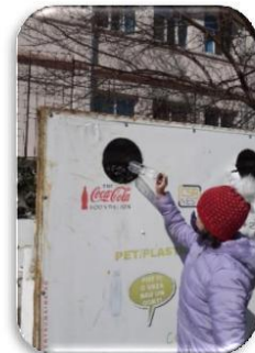
Tehnoredactat, Inf.Tănase Rodica