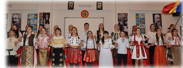
INSPECTORATUL ȘCOLAR JUDEȚEAN DĂMBŢIŢA CASA CORPULUI DIDACTIC DĂMBŢIŢA ȘCOALA GIMNAZIALĂ "CORESI" TÂRGOVIȘTE